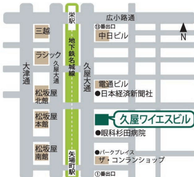
▼久屋ワイエスビル